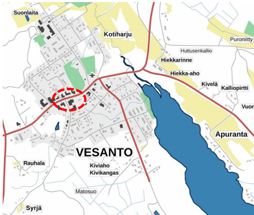
Kuva 1. Suunnittelualueen sijainti (punainen ympyrä)

Suunnittelualue sijaitsee Vesannon keskustassa Keskustien varrella. Suunnittelualueen koko on noin 0,17 ha. Alue on Osuuskauppa PeeÄssä:n omistuksessa.