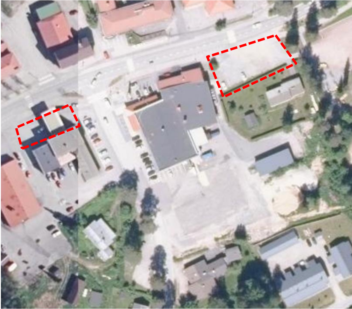
Kuva 2. Ortokuva suunnittelualueesta (Suunnittelualueen likimääräinen rajausta punaisella katkoviivalla).