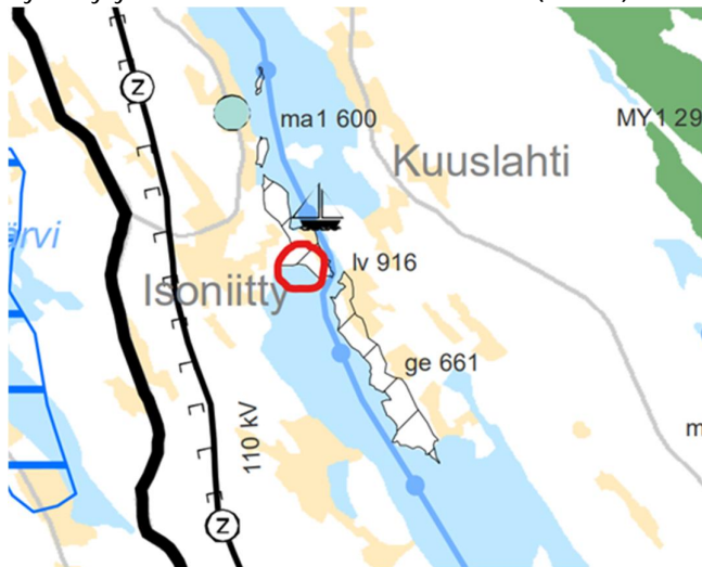
Kuva 3: Ote Pohjois-Savon maakuntakaavasta (suunnittelualue merkitty punaisella ympyrällä).

Alueella on voimassa Pohjois-Savon maakuntavaltuuston hyväksymä Pohjois-Savon maakuntakaava (8.11.2010). Ympäristöministeriö vahvisti kaavan 7.12.2011. Alueisiin ei kohdistu aluevarauksia. Ote hyväksytystä maakuntakaavasta on ohessa (kuva 3).